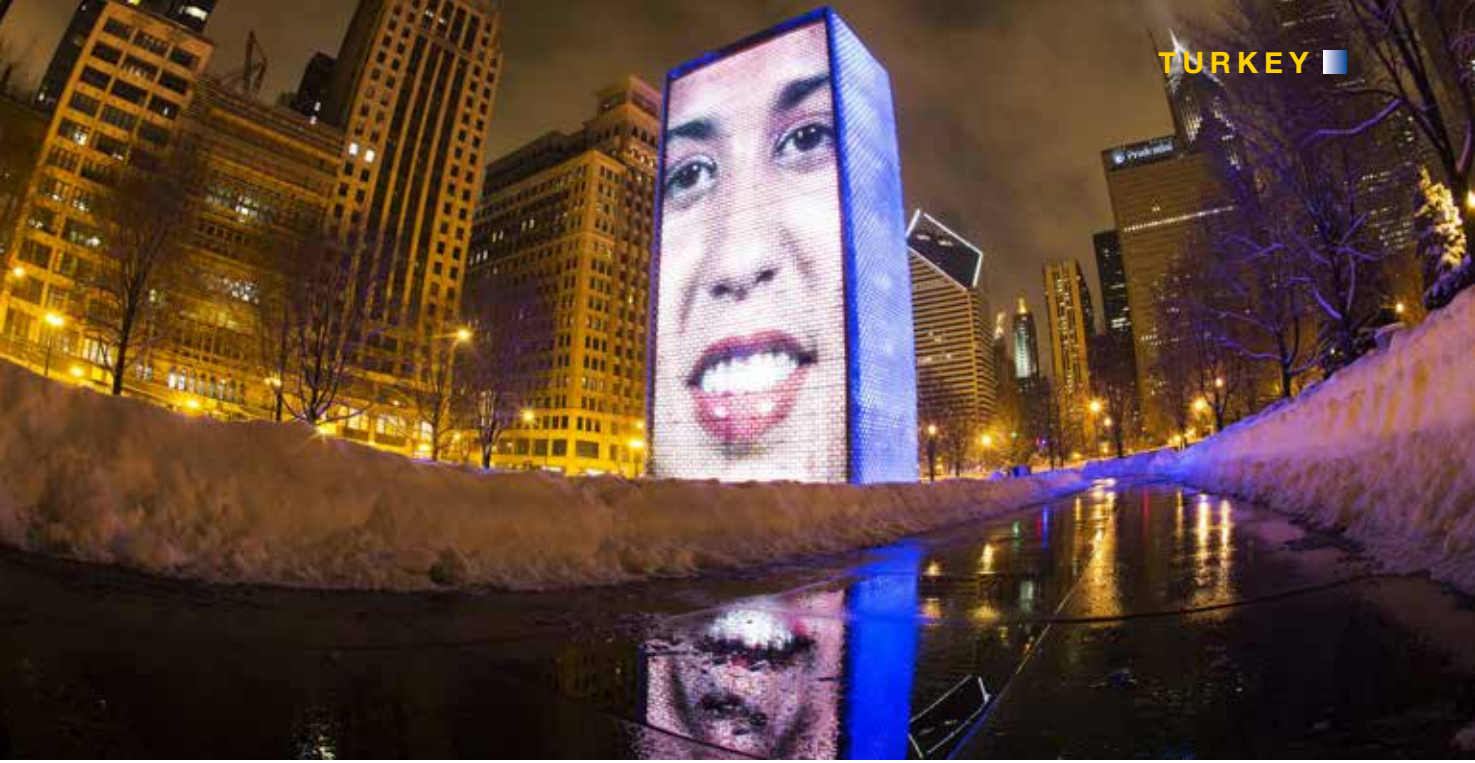
Millenium Parktaki The Crown Çeşmesi, Chicagoluların ağızlarından su fışkırtıkları yerdir.

Şehrin en çekici noktası olan Navy Pier, Chicagolular tarafından turistik atmosferinden ötürü alay konusu edilmektedir. Ancak Chicagolular'ın unuttukları bir şey var ki o da birkaç yıl öncesine kadar burası harap bir haldeydi ve unutulmuştu. Şehir ancak kısa zaman önce estetik açıdan memnuniyet yaratacak bir görünüme kavuştu. 150 fitteki Ferris dönme dolabı, size şehrin en güzel manzaralardan birini sunmaktadır. Atlıklarınca nostaljik ve renklidir ve Beer Garden'da sunulan bira her zaman soğuk ve pahalıdır.