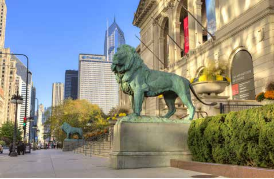
Chicago Sanat Enstitüsü, Lionlar için doğal bir fotoğraf noktasıdır.

si'nde bırakabilir veya El durağı ya da daha uzakta olan iki tanesi geniş evleri ve modaya uygun kafeleri ve barları olan daha üst sınıfa mensup bir yerleşim yerine gidebilir. (The Chicago Transit Authority Trenleri "EL" veya "L" olarak bilinir, "yüksek" kısaltması, üst kat demiryolu, bazı trenler yer altı ya da yer seviyesinde çalışırlar).