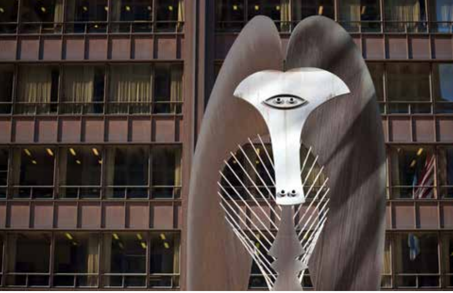
Loop'un en önemli noktalarından biri de Picasso'nun isimsiz heykeldir.

go'da, 30 Haziran'dan 4 Temmuz'a kadar bulunmak bir Lion için harika olacaktır. Şehir etkileyici mimarisi, birinci sınıf müzeleri, nefes kesici göl kenarı, muhteşem yemekleri ve son olarak North Side Büyük lig beyzbol takımı ile muhteşem bir mücevher niteliği taşıyor.